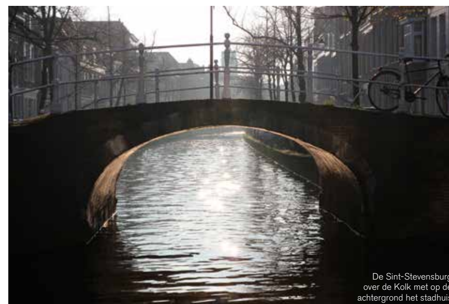
De Sint-Stevensburg over de Kolk met op de achtergrond het stadhuis