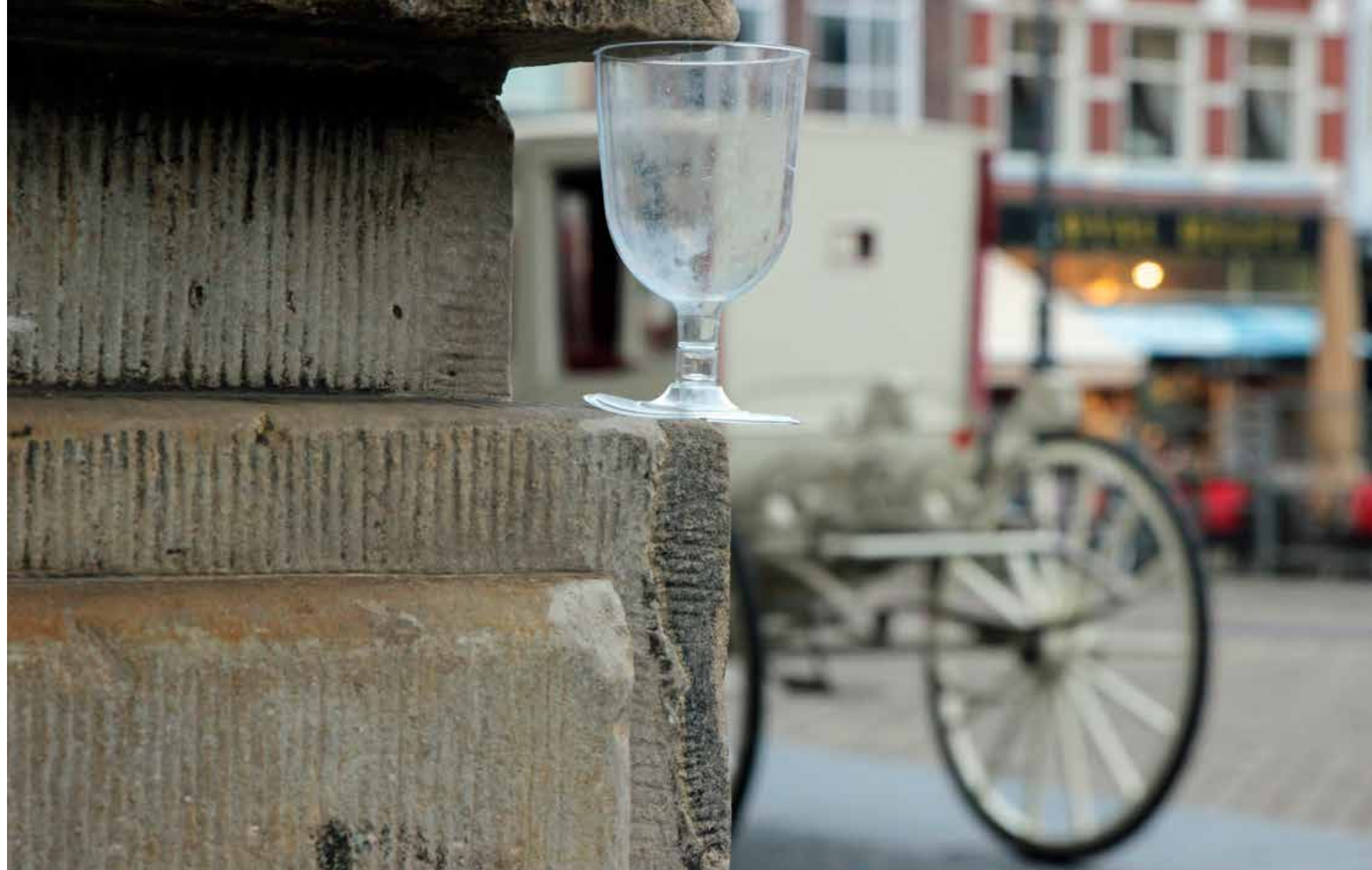
Koets voor het stadhuis. Glaasje op, laat je rijden