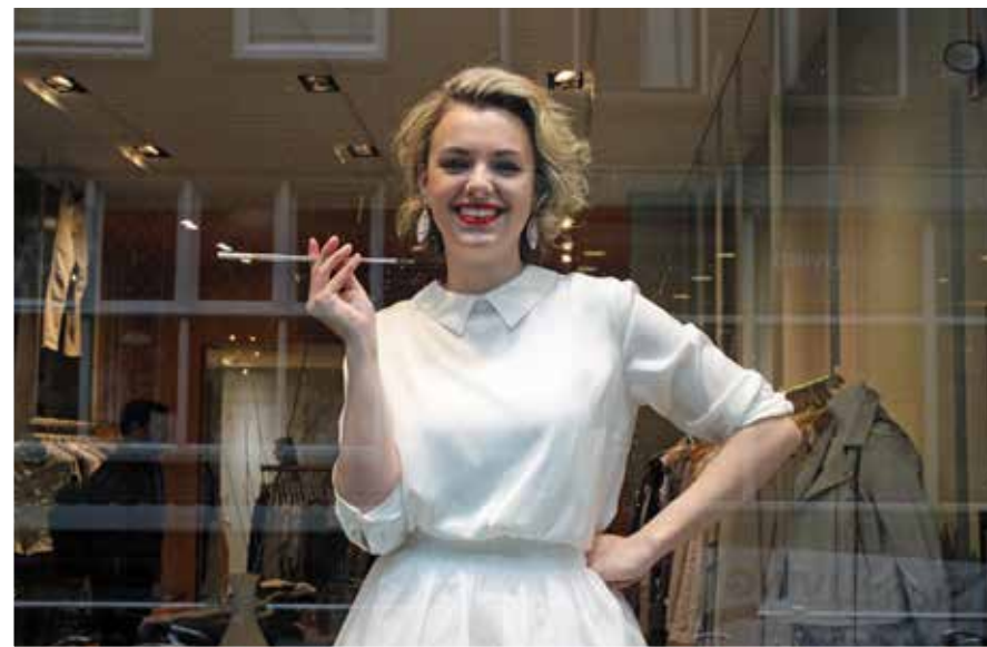
Rokende etalagepop tijdens de Levende Etalage Dag in april 2015