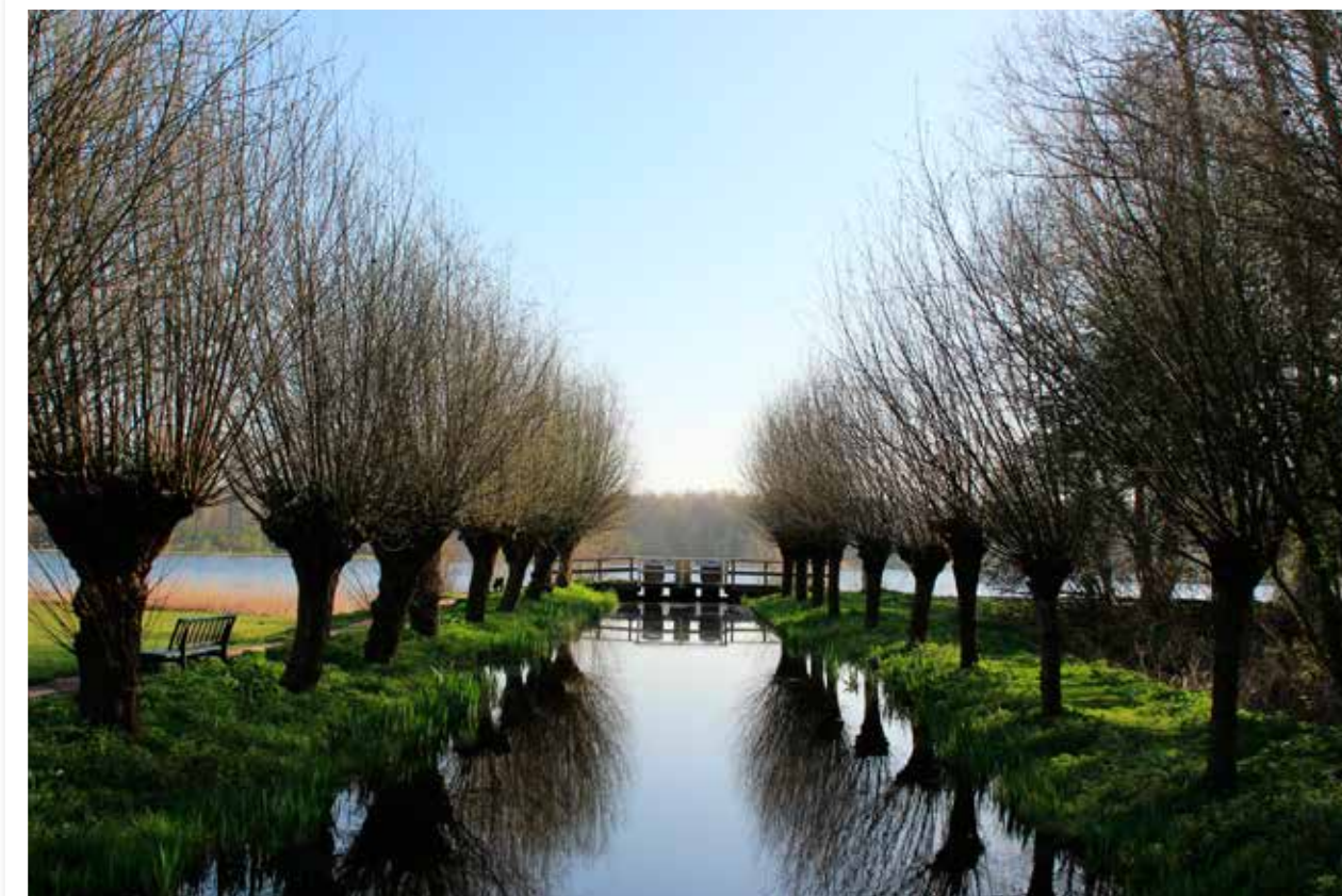
Rust in de Delftse Hout

TEKST CAROLINE LUDWIG