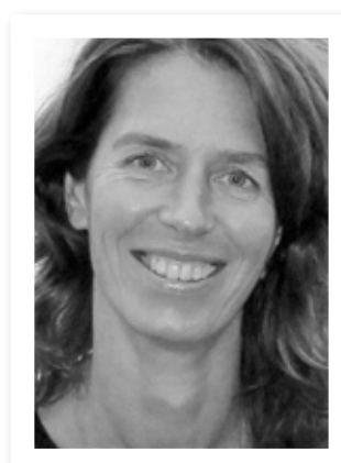
Delft is een dankbaar onderwerp voor fotografe Anita Bastienne van den Berg

Wil je Anita volgen? Zie http://anitabastienne.wordpress.com