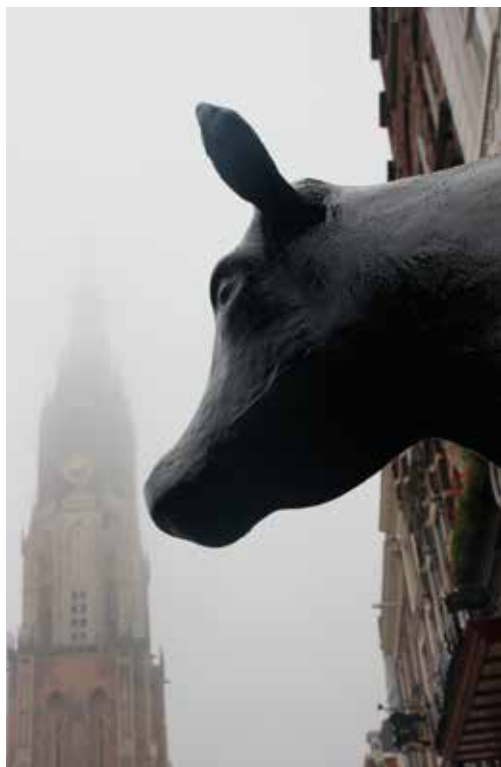
Een koe snuffelt aan de Nieuwe Kerk